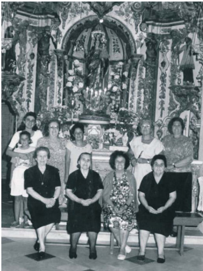
Grupo de devotas y «vecinas de la Virgen». Década 1980