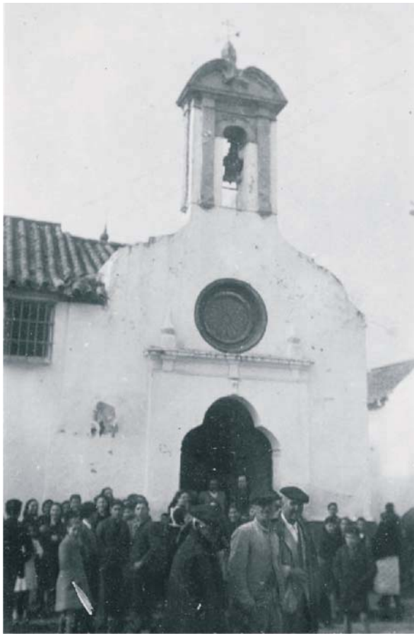
Exterior de la Capilla. Año 1941