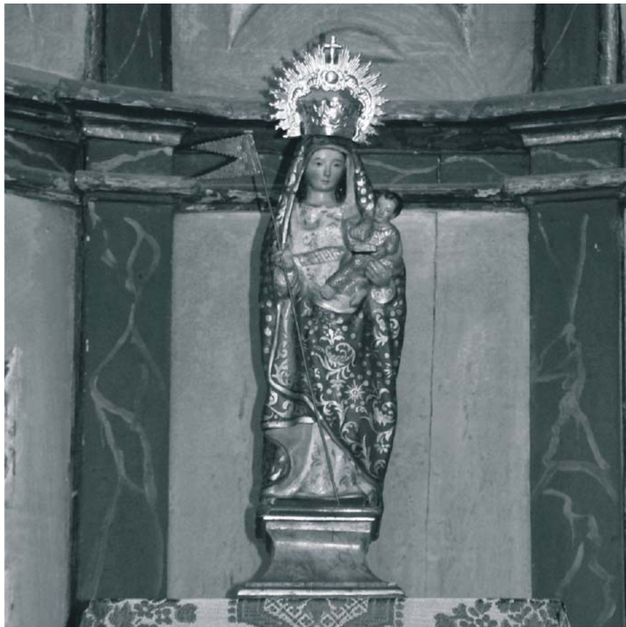
La conocida como imagen primitiva de la Virgen