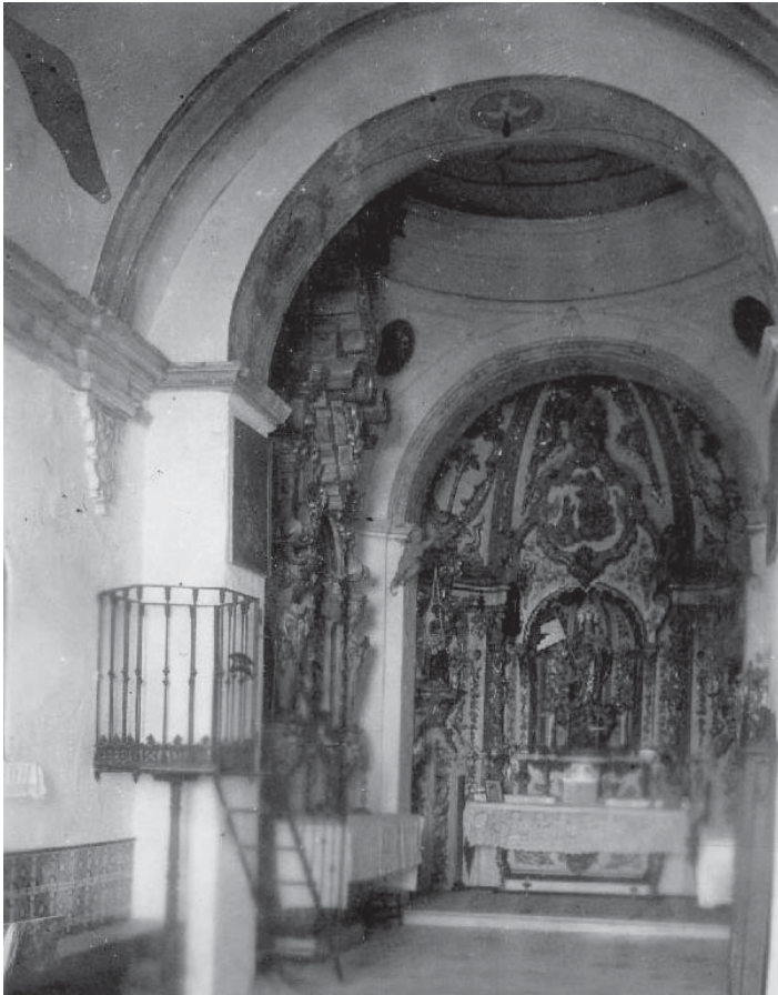
Interior de la Capilla. Año 1941