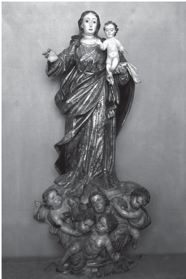
Imagen de la Virgen y el Niño sin corona, potencias ni bandera. Año 1941