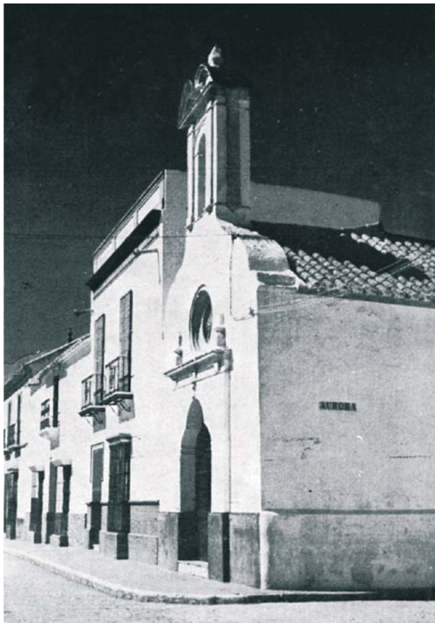
Vista lateral de la Ermita. Década 1960