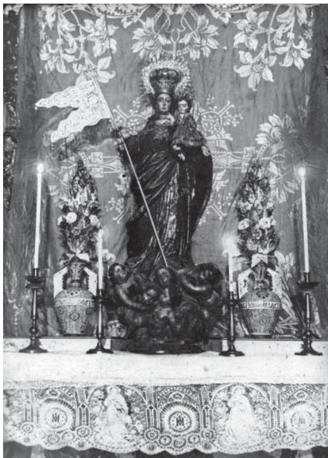
La Imagen Titular en un altar efímero a finales del siglo XIX