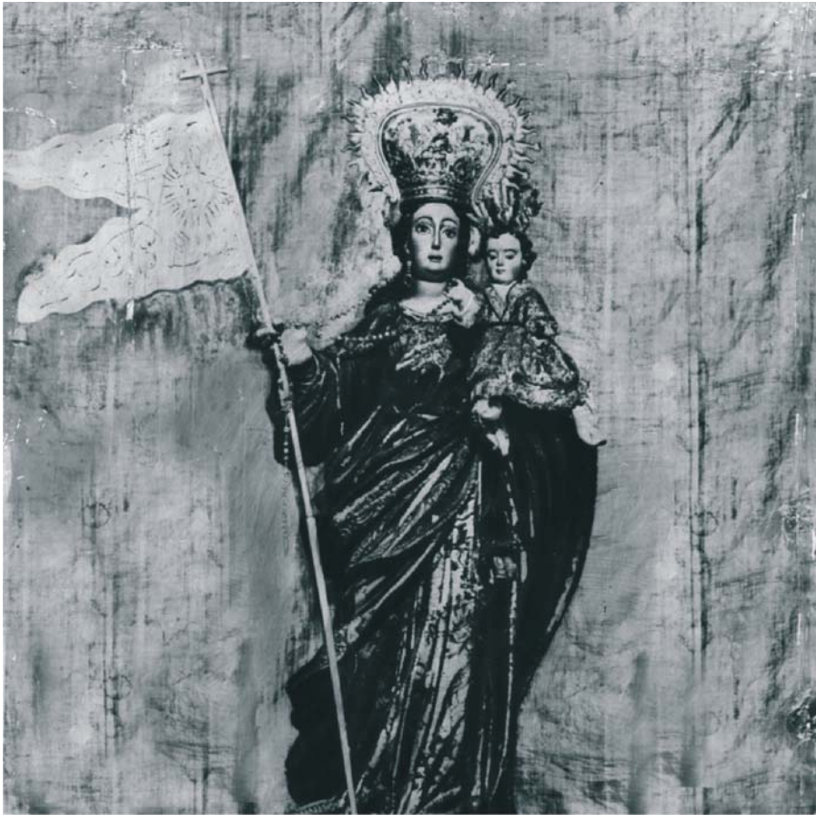
Finales siglo XIX - principios siglo XX